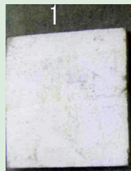
カビ抵抗性試験-木片表面(実期間3年相当経過)